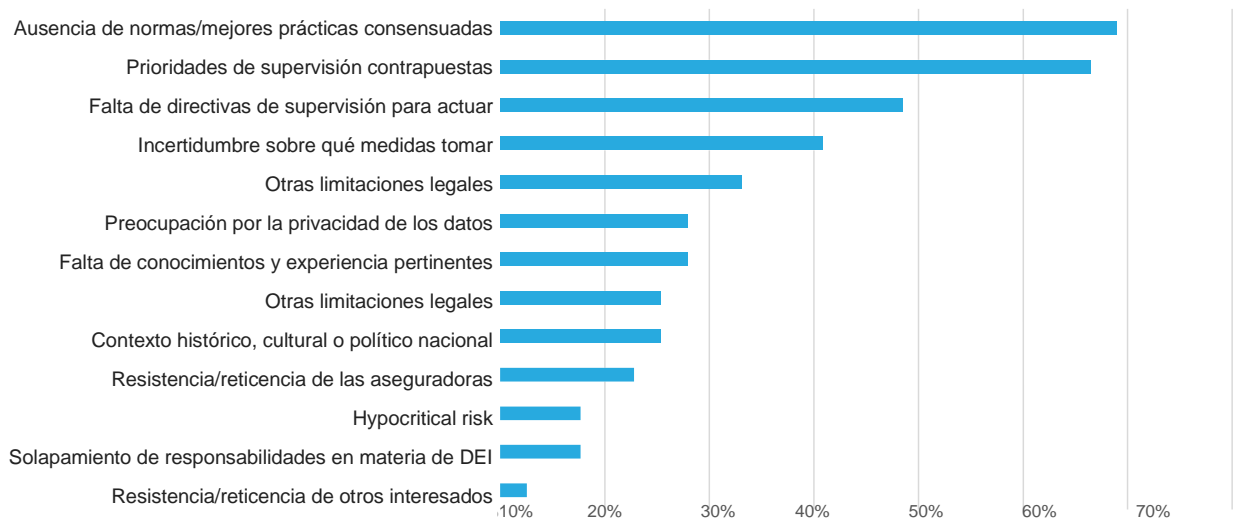
Figura 2: Los desafíos de supervisión más comunes

El gráfico 2 muestra la distribución de las respuestas a esta pregunta.